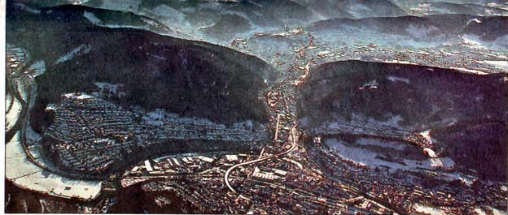
Die Affelnerin Mirja Klicks hielt diesen Blick aus dem Cockpit ihres Segelfliegers mit ihrer Kamera fest – jetzt gehört ihre Aufnahme mit zu den ausgewählten Motiven für den Bildband „Westfalen entdecken“.